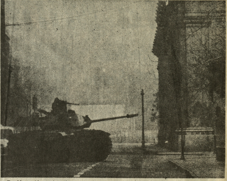
En Morandé, en la misma esquina de esa calle con Moneda, y a escasos dos o tres metros de los muros del Palacio de Gobierno, este tanque apunta su cañón hacia la puerta principal del edificio. En su torre, un soldado dispara con ametralladora. Se puede apreciar detrás del tanque una ambulancia atenta para recoger a cualquier herido