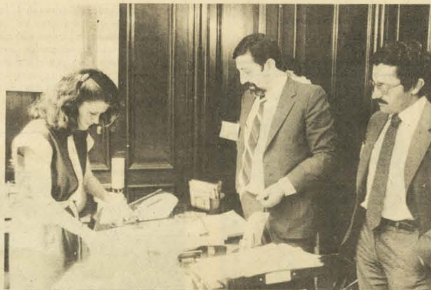
UNA FOTO HISTORICA. Dirigentes de ADHICH entregan a la Secretaria de la Corte de Apelaciones, la primera de las demandas que, masivamente, entablarán contra entidades financieras y de crédito. Esta fue contra el Banco de Santiago y se presentó el día 31 de enero pasado.

Al denunciar la insensibilidad de las autoridades ante el drama del endeudamiento