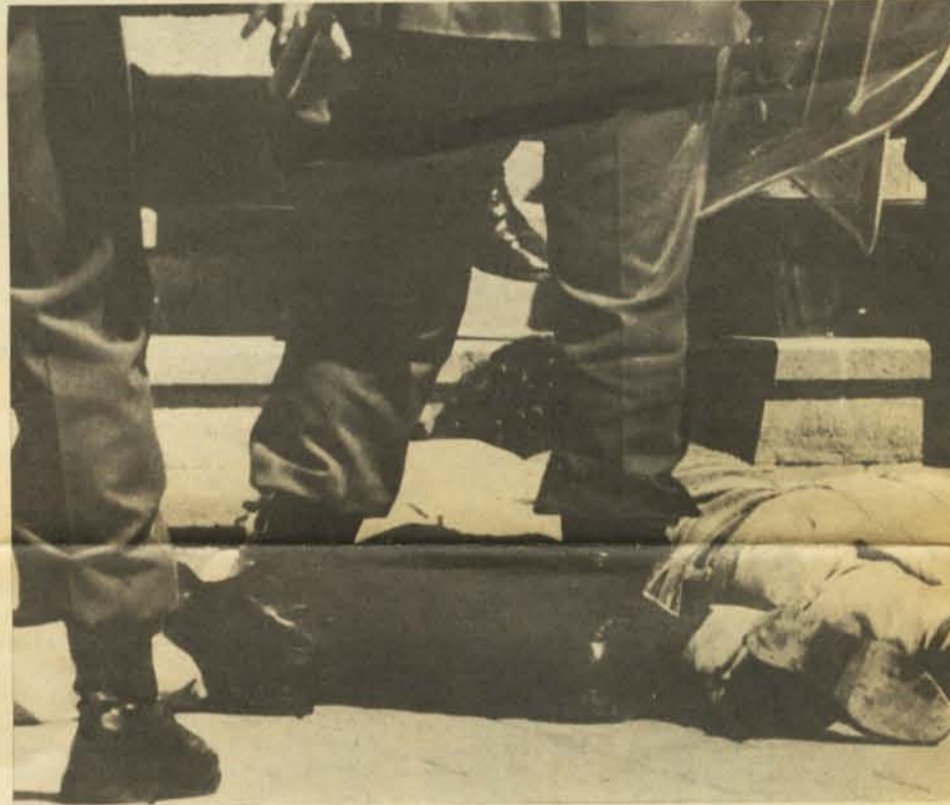
El hombre es el lobo del hombre.

En carabineros esta transformación adquiere visos especialmente claros. Desde el mismo golpe se militarizaron. Su funcionamiento dejó de ser el de una policía preventiva, encargada del servicio a la comunidad y estrechamente relacionada a la civilidad, para transformarse en un órgano más de represión al servicio de la doctrina de la seguridad nacional.